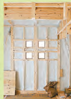
高い気密性を実現する特殊ウレタンの吹き付け断熱