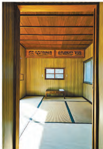
離れ風の客室。壁はしっくい仕上げ