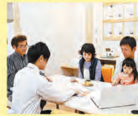
お家づくりに関することは何でもご相談ください

お家づくりは皆様初めてのこと。不安や疑問がたくさんあることでしょう。中でも資金についての不安は大きいと思います。「自分たちにお家を建てることのできるのだろうか?」「月々どんな生活になるのか全然分からない...」「必要な費用ってどんなもの?」「住宅ローンってどう選べばいいの?」などなど。エスケイハウジングは、そんな不安を解消する「見学会」や「お家づくり相談会」を開催しています。決して売り込みはしません。お気軽にご相談ください。