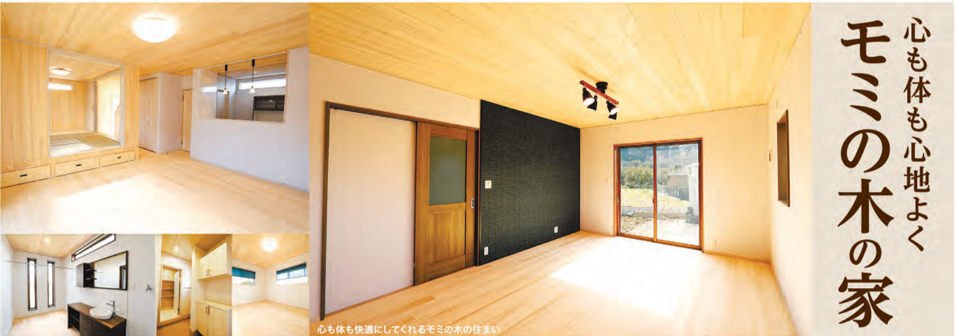
心も体も快適してくれるモミの木の住まい