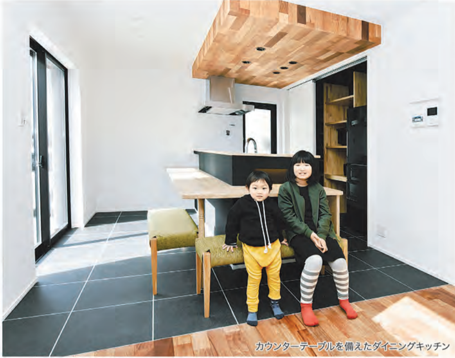
カウンターテーブルを備えたダイニングキッチン