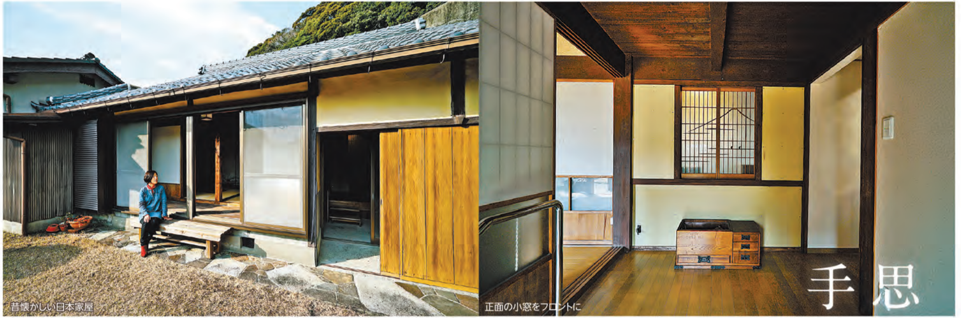
昔懐かしい日本家屋