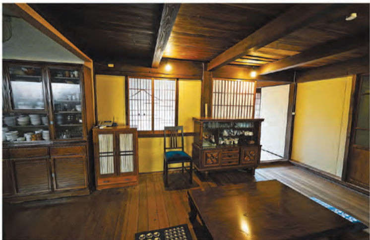
和風になった談話室

オープン予定は今年夏。家族の思い出の詰まった軒下で、新たに旅人が思い出を紡ぐのだろう。