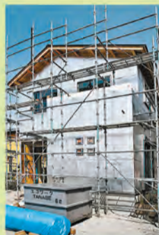
太陽光を97%カットする遮熱シート

エスケイハウジングは17年以上前からこの高気密高断熱住宅を専門につくり続けています。ひと口に高気密高断熱住宅を建てるといっても、会社によって断熱材や工法等は違うので、選ぶ基準をしっかりと持つことが大切です。エスケイハウジングの高気密高断熱住宅は光熱費の節約に加えて「結露が発生しない」のも大きなポイントです。