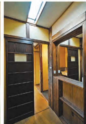
サンタリー周辺も新しく