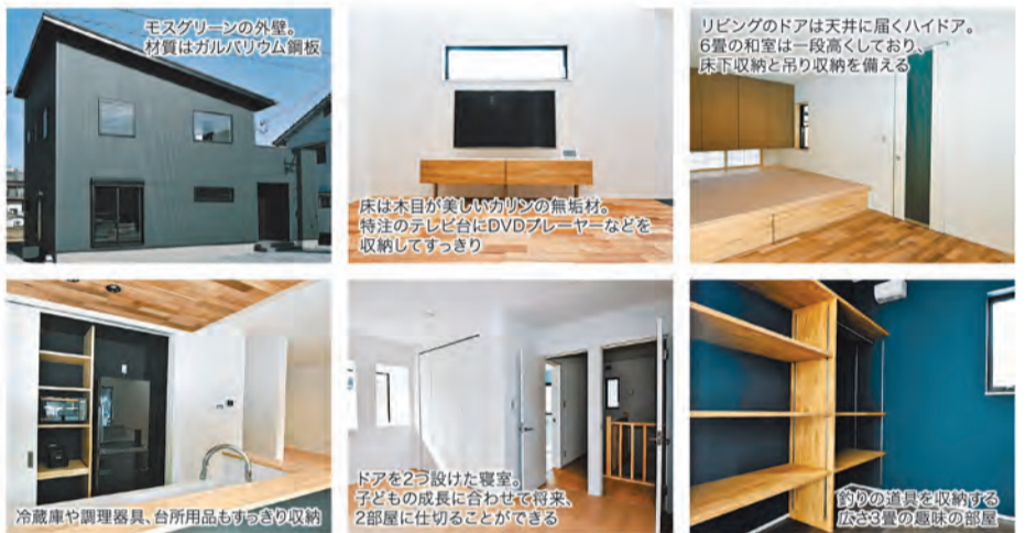
モスグリーンの外壁。材質はガルバリウム鋼板