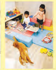
キッズスペースがあるのでお子様連れでも安心