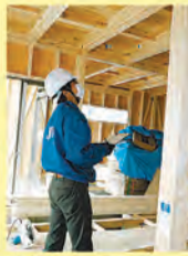
構造体の見学もできます