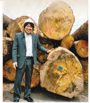
使用するドイツ産モミの木

天然の機能があり、無節・柱目で見ても美しく、肌触りも心地よいモミの木。 調湿効果や消臭効果、抗菌・防虫効果に優れている。また、森林浴効果の香り成分「フィトンチッド」が豊富で、アレルギーなど体のトラブルを和らげたり心や体を癒やしたりする。「心地良さを体感できた」と見学会などでも好評。 床や壁など内装に使用し、リフォームもできる。モミの木の良さを発揮するよう施工。機能性を生かすのはもちろん、美しさや温かみが住空間を引き立てる。