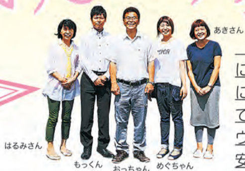
はるみさん もっくん おっちゃん めぐちゃん あきさん

住まれてから もっと家族仲良く幸せいっぱい 暮らしていただけるお家づくりを お手伝いさせていただきます！