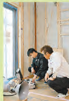
施工現場での気密測定